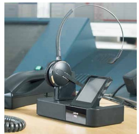
Die perfekte Ergänzung: schnurlose Headsets z. B. von Jabra