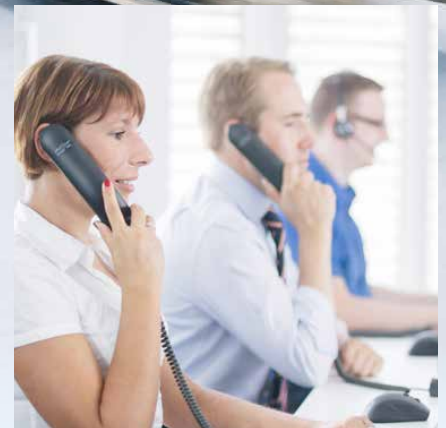
Aus der Praxis entwickelt: Plathosys Produkte