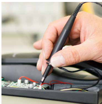
Individuell auf die Wünsche unserer Kunden abgestimmt