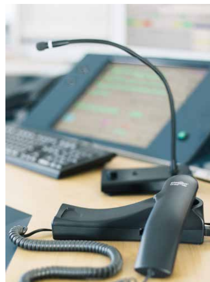
Der formschöne und robuste Plathosys CT 260 PRO Handapparat mit PTT/PTM-Funktion