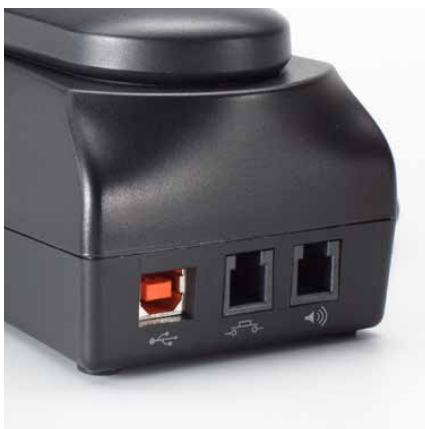
Vielseitige Anschlussmöglichkeiten zeichnen das CT 260 PRO aus